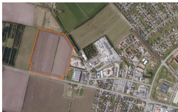
Placering af projektområdet ud til Vester Landevej

Projektområdet er beliggende i den nordvestlige del af Varde ved Vester Landevej og udgør ca. 10 ha. Mod øst grænser området op til eksisterende erhvervsområde og byzone.